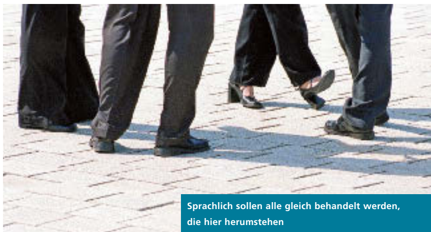
Sprachlich sollen alle gleich behandelt werden, die hier herumstehen