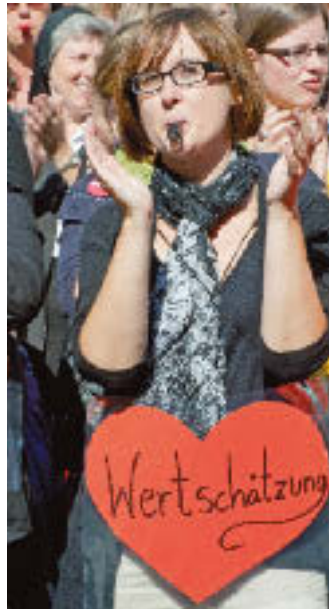
Wahrnehmung und Wertschätzung sind Schwestern

Populär und verbreitet sind mittlerweile vier Formen des Genderns: Binnen-I (Gewerkschaft-